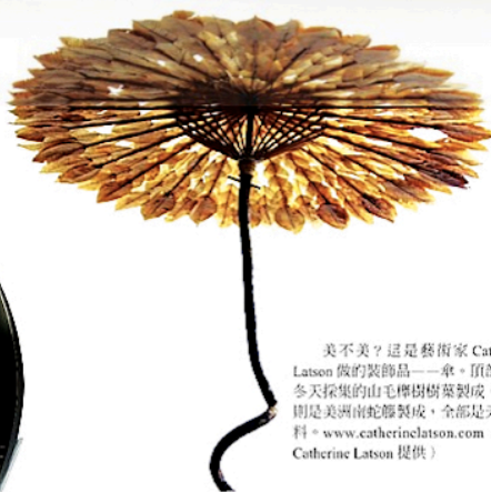
美不美?這是藝術家 Catherine Latson 做的裝飾品——傘。頂部是用冬天採集的山毛榉樹葉製成，傘柄則是美洲南蛇藤製成，全部是天然材料。www.catherinelatson.com (圖: Catherine Latson 提供)

您能看出這是一款什麼產品嗎?可能您很難想像，這是世界領先的抽油煙機品牌 BEST 的 Sorpresa 系列最新款的抽油煙機!銅和玻璃的兩種不同材料，通過柔美的曲線結合在一起，商家自己也承認是受到中國古老陰陽哲學的影響。當然，對於做飯時油煙較大的中國客戶，商家還有其他大功率機型來滿足客戶需求。更多產品請見: www.bestorspresa.com (圖: BEST 提供)