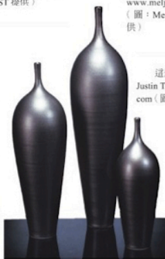
這是獲得無數獎項的藝術家 Justin Teihet 製作的陶瓷作品。Justin Teihet 作品以追求簡潔的美而著稱。www.jteihetporcelain.com