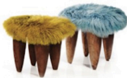
NOA Living 的 Fufu 系列小凳 www.noaliving.com