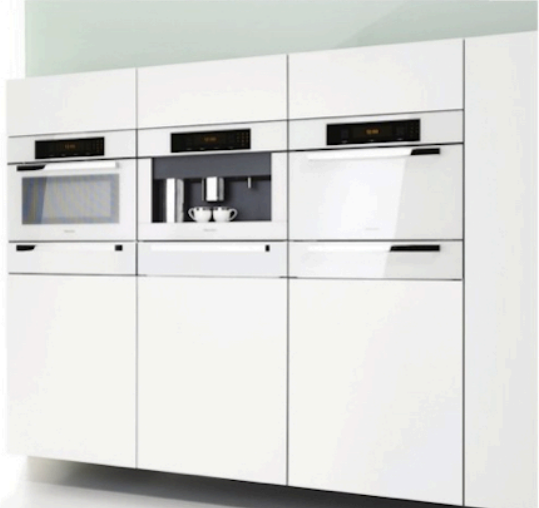
頂級廚房家電品牌德國 Miele 的純白款廚房家電，今年 Miele 的蒸汽烤箱又推出新產品，水箱不再在烤箱內，而是隱藏在上面的操作板後，也就是同樣的規格，容量卻加大了很多，更美觀實用。www.miele.com

【大紀元記者李子容紐約報導】3月21日至24日，第12屆 Architectural Digest (《建築設計》雜誌) 家居設計展 (Home Design Show) 在紐約市12大道與55街交匯處、94碼頭舉辦。